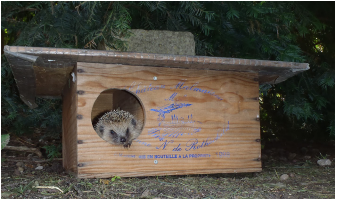
Anstatt eines edlen Tropfens ein stacheliger Gast: Eine wiederverwertete Weinkiste ergibt ein ideales Sommerschlafhaus.